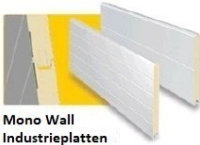
Mono Wall Industrieplatten