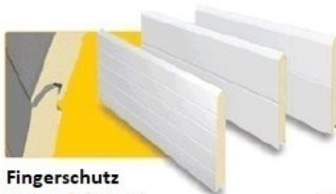
Fingerschutz Sicher (Platten)